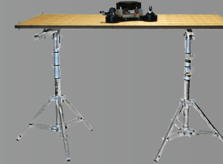
Support T 0,70m à 1,70m