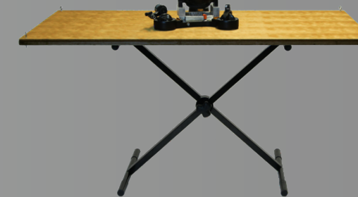
Support X 0,70m à 1,70m