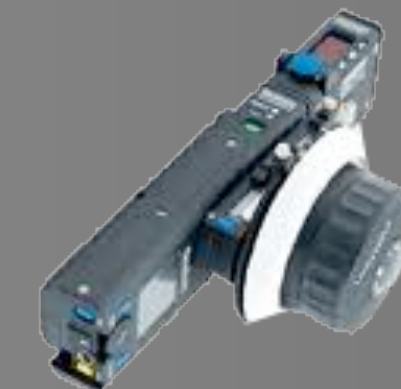
Commande Point / Zoom / Diaph