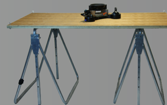
Support Y 0,70m à 1,70m