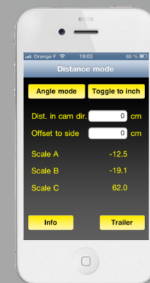
Appli iPhone / iPod Palm / Excel